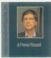
di Franco Ricciardi

La proprietà intellettuale è riconducibile alla fonte specificata in testa alla pagina. Il ritaglio stampa è da intendersi per uso privato