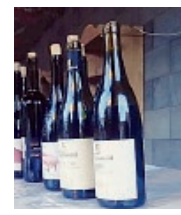
Il vino protagonista della kermesse

Prosegue la seconda settimana di ViniMilo, la manifestazione dedicata alle produzioni d'eccellenza Etna Rosso Doc e soprattutto Etna Bianco Superiore Doc (esclusiva del territorio di Milo) coltivate sui terrazzamenti che dal vulcano patrimonio dell'Unesco arrivano fino al mare. In programma, accanto agli eventi "gourmet" organizzati da cantine e aziende partner, degustazioni aperte al grande pubblico nei due weekend e che la domenica, per accogliere i giganti alla scoperta del-